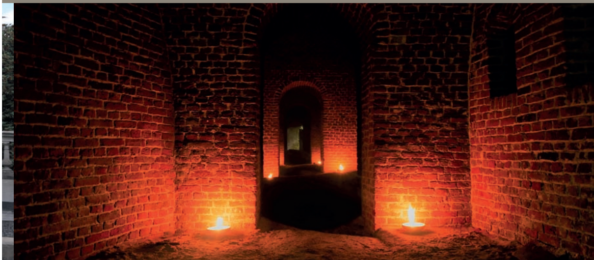
Casemates L. Dubuisson