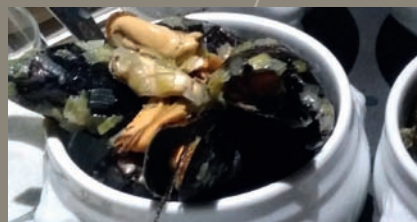
A la table de l'histoire antique

À l'Espace gallo-romain, vous assisterez à une veillée funèbre et accompagnerez la procession qui mène le défunt vers le bûcher et la tombe. Vous approcherez les coutumes funéraires grâce aux découvertes archéologiques réalisées dans la cité des Nerviens. La démarche des archéologues et anthropologues ainsi que leur méthodologie face à une tombe et à son matériel vous seront exposées au sein même d'un laboratoire reconstitué. De plus, pour célébrer le dernier jour de la Ducasse d'Ath, à l'occasion duquel tous les Athois dégustent des moules, tous les secrets de la récolte et de la préparation de ces coquillages durant l'Antiquité vous seront révélés.