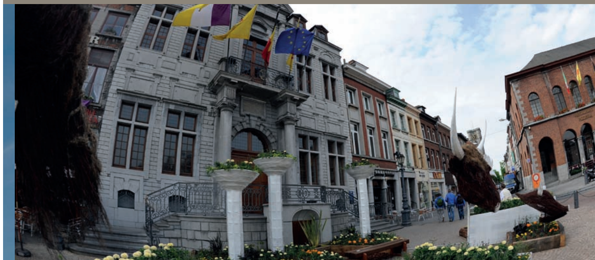
Ath Hôtel de Ville