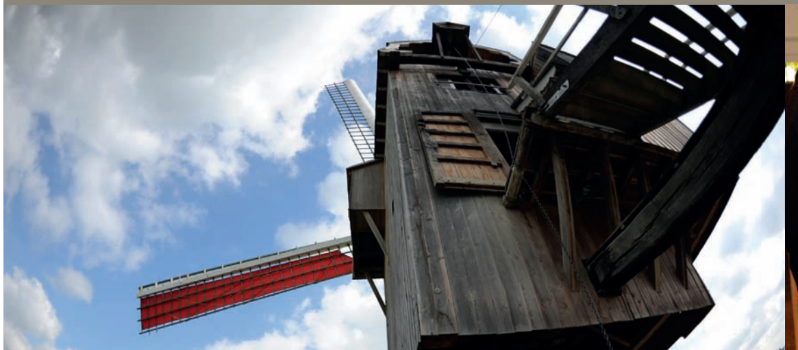
Moulin Moulbaix