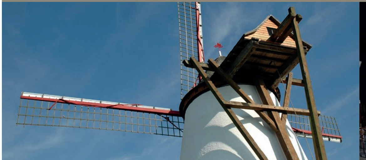
Blanc moulin Ostiches