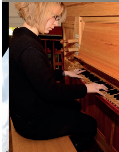
orgue