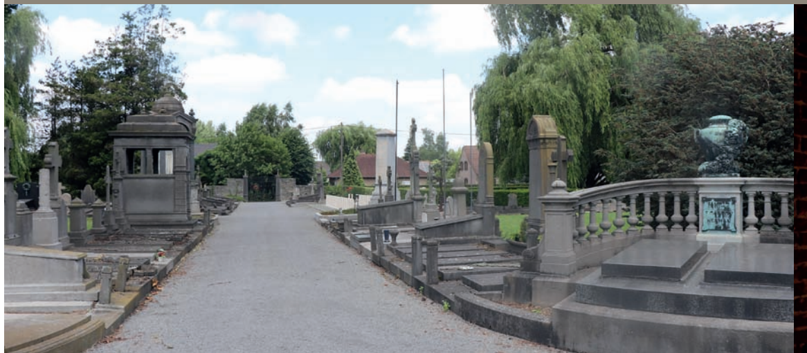
Ancien cimetière d'Ath

Suite à l'édit de 1784, les cimetières de la ville doivent migrer hors des fortifications. Un nouveau cimetière est alors installé au faubourg de Bruxelles à partir de 1786 et mis en service en 1788. Devenu trop petit et sans possibilité de s'étendre, il cesse ses activités dans les années 1930. Aujourd'hui, il évolue vers une affectation cinéraire.