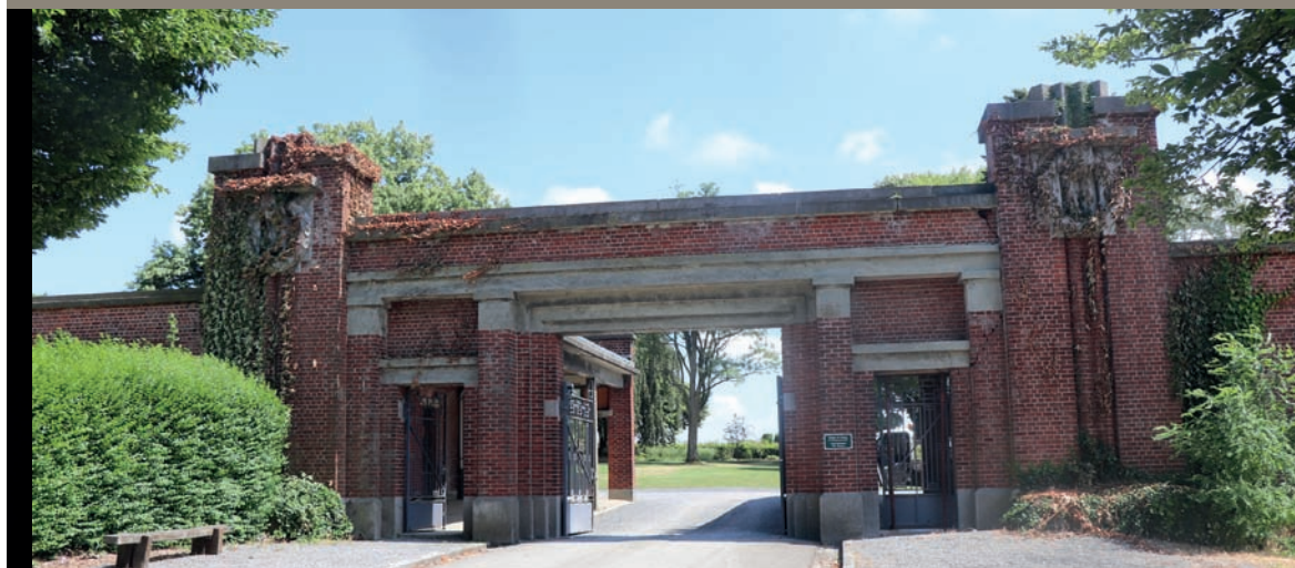
Cimetière communal d'Ath